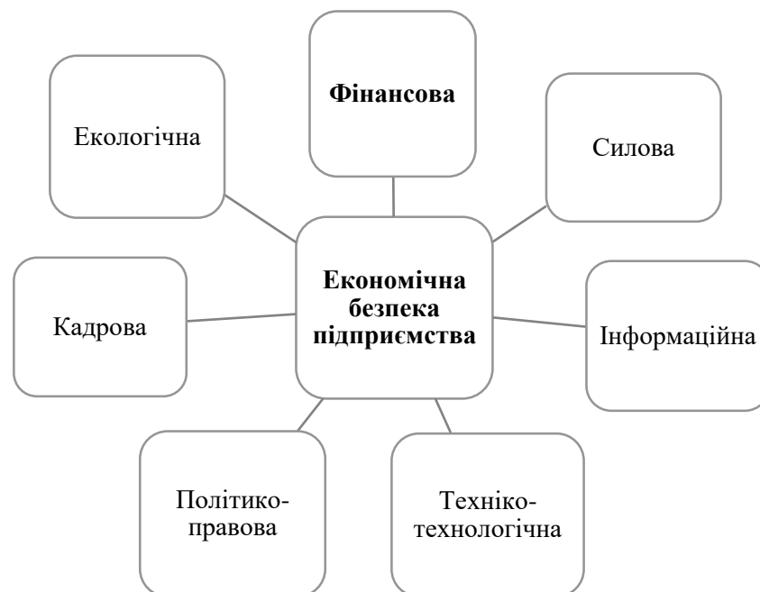
Рис. 1. 1. Складові економічної безпеки підприємства

Таким чином, економічна безпека підприємства (рис. 1.1) являє собою стан, за якого підприємством досягається високий рівень конкурентоспроможності на ринку за найбільш ефективного використання ресурсів, сталого розвитку і адаптивності до зовнішніх та внутрішніх загроз [4].